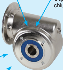
Riduttore RFV40, RFV50 o RFV63 , Rapporto di riduzione da 7,5/1 a 100/1 3 flange a scelta a seconda del motore scelto