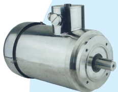
Motore da 0.18 kW a 1.5 kW