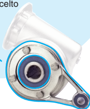
Braccio di reazione RFV-BR per sostenere meglio il carico