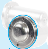
Coperchio di protezione chiuso RFV-CAP