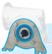
Piedi di supporto RFV-FP

Ideale per le applicazioni agroalimentari