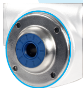
Coperchio di protezione RFV-CAP aperto o chiuso per evitare la ritenzione di sporco nell'alesaggio in uscita