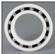
SS: sfere inox