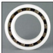
GL: sfere in vetro