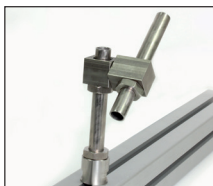
Esempio di applicazione