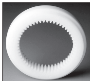
IN : Acciaio