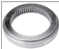
IN : Acciaio