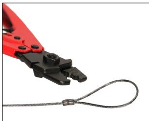
Esempio di applicazione